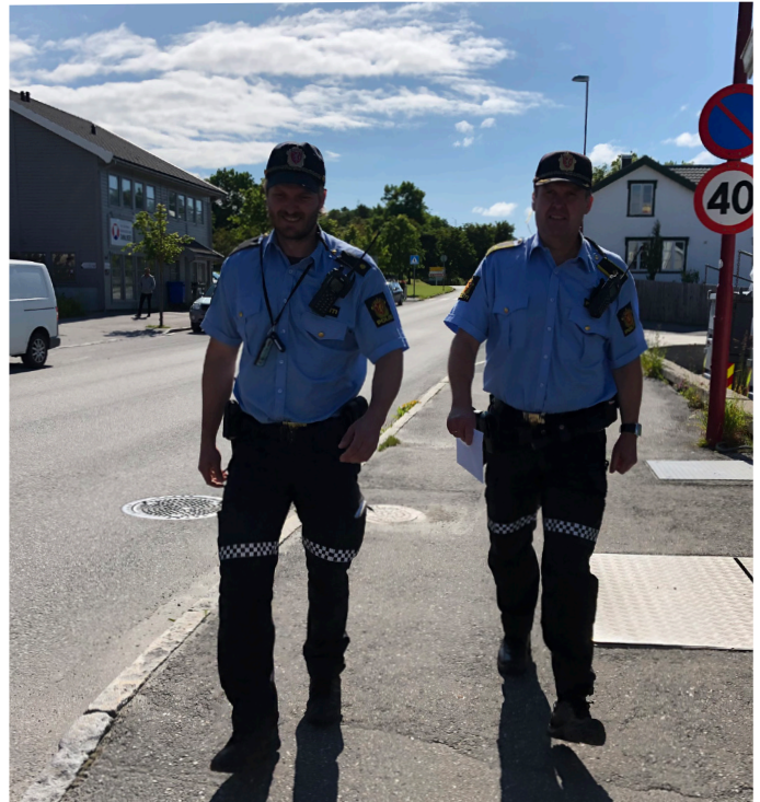
Det er et mål å ha et synlig politi som er der når folk trenger det. Det jobber vi for hver eneste dag. Her fra patruljen i Brønnøysund.

Gjennom 2019 har politidistriktet jobbet målbevisst for å få ned restansene, det