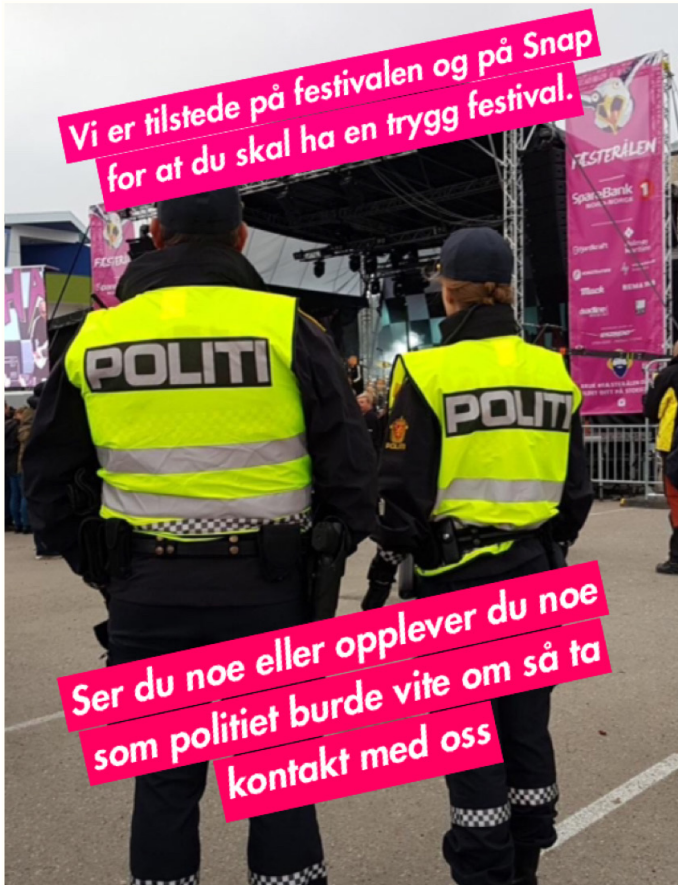
Nettpatruljen var tilstede på Snapchat på festivalene; Verke, Fæsterålen, Opptur og Parken. Bildet viser ett av innleggene fra snapchatkontoen "Politiet på Fæsterålen".

Politiet i Nordland har vært på Facebook i mange år allerede, men har i løpet av siste året gjort en satsing for å profesjonalisere vår tilstedeværelse på nett. Vi har opprettet Nettpatruljen og igangsatt et mer solid system for å holde kontakt med publikum.